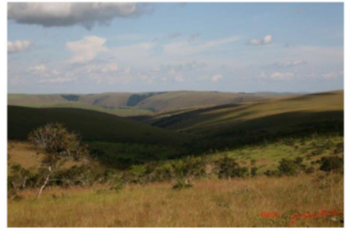
Plateaux de Batéké