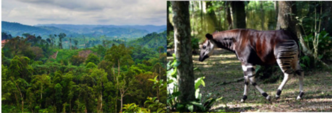
Zamba ya Ituri