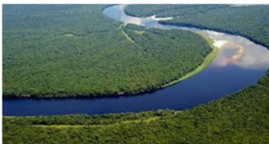
Ebale ya Congo