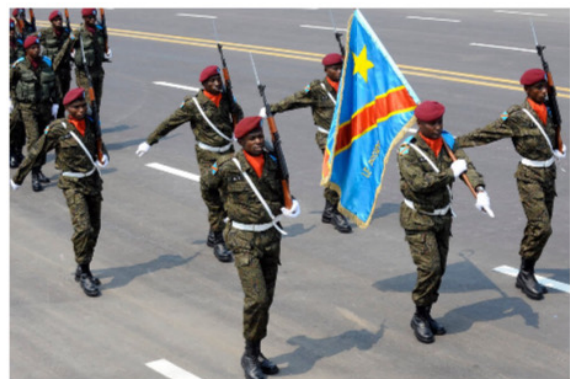
Feti ya lipanda