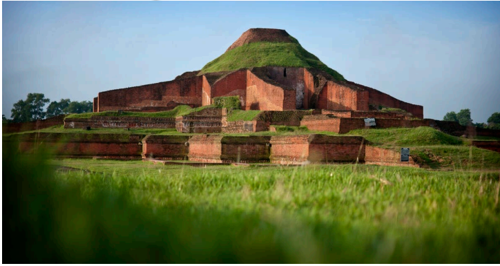
Les ruines du Vihara bouddhique de Paharpur