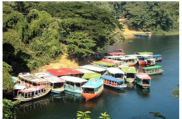
Le lac Kaptai