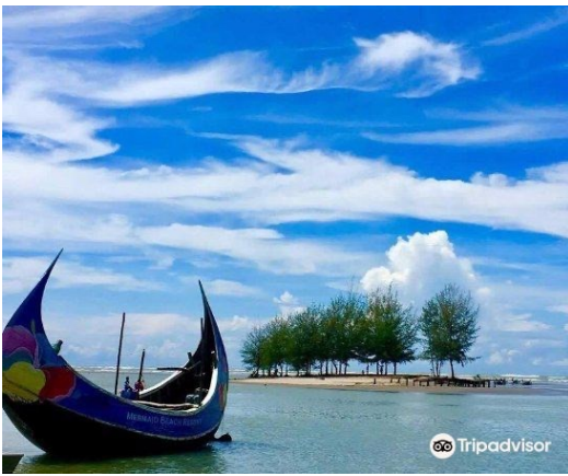
La plage de Cox's Bazar